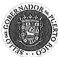
Government Entity of the Year Office of the Chief of Staff